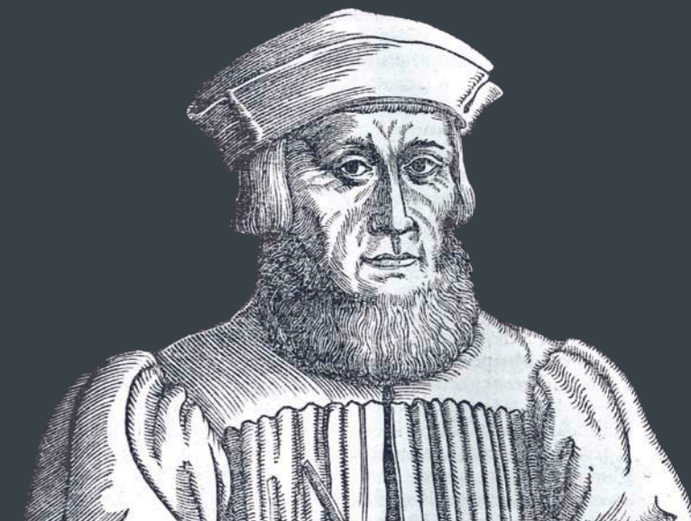
Johann Turmair, Stich aus Annalium Boiorum, 1554

Der Sohn eines Abensberger Mauerermeisters war studierter Jurist und machte während der napoleonischen Zeit Karriere. Nach 1813 widmete er sich der Einführung aufgeklärter Methoden in die Landwirtschaft.