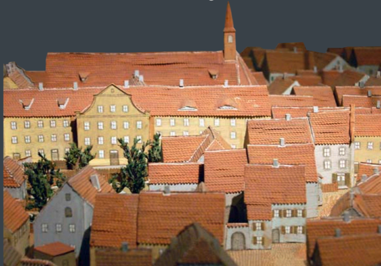
Modell der Stadt Abensberg von Josef Merkl, um 1938

Ein fester Bestandteil der Abensberger Geschichte ist der älteste Jahrmarkt Bayerns: Der Gillamoos. Der Name geht zurück auf eine kleine Kapelle, die dem Heiligen Ägidius geweiht war. Aus einer Wallfahrt zu diesem Viehpatron entwickelte sich der Gillamoos. Im Museum ist die originale Figur des Heiligen aus der abgebrochenen Ägidiuskapelle zu sehen.