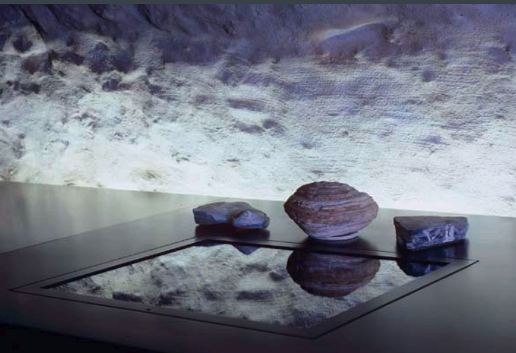
Feuersteinknollen aus Arnhofen

Das Stadtmuseum Abensberg lädt Sie zu einer faszinierenden und abwechslungsreichen Reise durch die Geschichte Abensbergs ein.